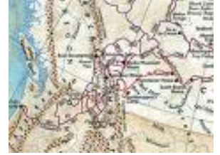
David Thompson'ın haritası

David Thompson 1799'da Charlotte Small ile evlendi. Charlotte İskoç bir baba ile yarım kan Cree olan bir annenin kızı olarak dünyaya gelmişti. Nikahları 30 Ekim 1812 tarihinde Montreal'de bulunan bir İskoç Presbiteryen Kilisesi'nde kıyıldı. Charlotten on üç çocuğu oldu. Aile Doğu Kanada'daki hayatlarına pek alışmadı. Çocuklarının iki tanesi kurt şeklindeki parazitlerden dolayı erken