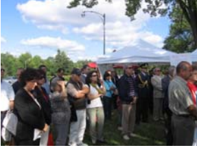
Şehit Askeri Ataşe Atilla Altıkat anma töreni: gündüz

“Kuruluşumuzun temel amacı, kayıtlı ve resmi lobicilik yapmak. Bu konuda bir boşluk olduğunu düşündük.”