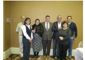
Ataol Behramoğlu, soldan besinci, dernek yöneticileri ile birlikte

Yaklaşık 75 kişilik dinleyici grubunun katıldığı gece doyumsuz güzellikte geçti. Sayın şairimize, geceyi düzenleyenlere ve sevgili dinleyicilerimize teşekkür ederiz.