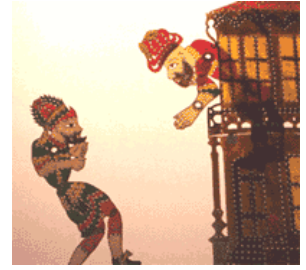
Karagöz ve Hacivat